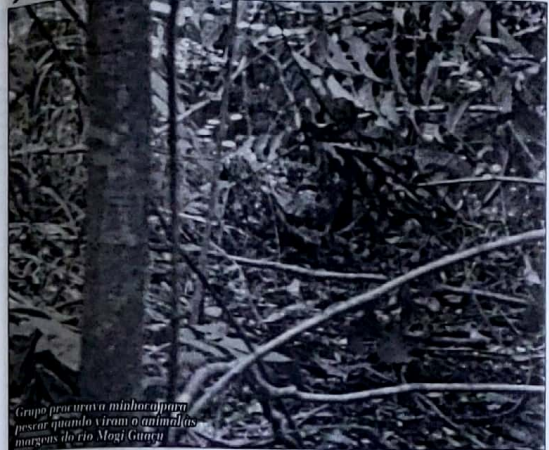
Grupo pescou uma fêmea que estava cuidando do ninho de jacaré no rio Mogi Guaçu.

PROGUAÇU S/A - EMPRESA MUNICIPAL DE DESENVOLVIMENTO E HABITAÇÃO DE MOGI GUAÇU